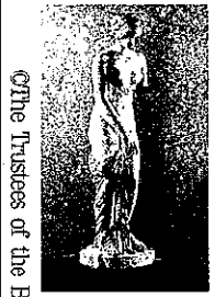
Ornie Tristees of the British Museum

れて驚いているようなポーズが人気で、多くのコピーや本作のような変形版が作られた。