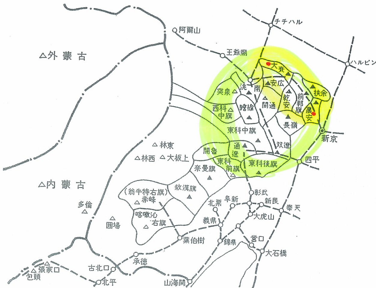
満洲に於ける1933(昭8)年より1943(昭18)年までのペスト患者発生数

▲印 多発した県旗 △印 原発したところのある県旗及び地方 面積 128,812,950 km 2 街村 374 戸数 673,020 人口 4,292,847 (1940年国勢調査)