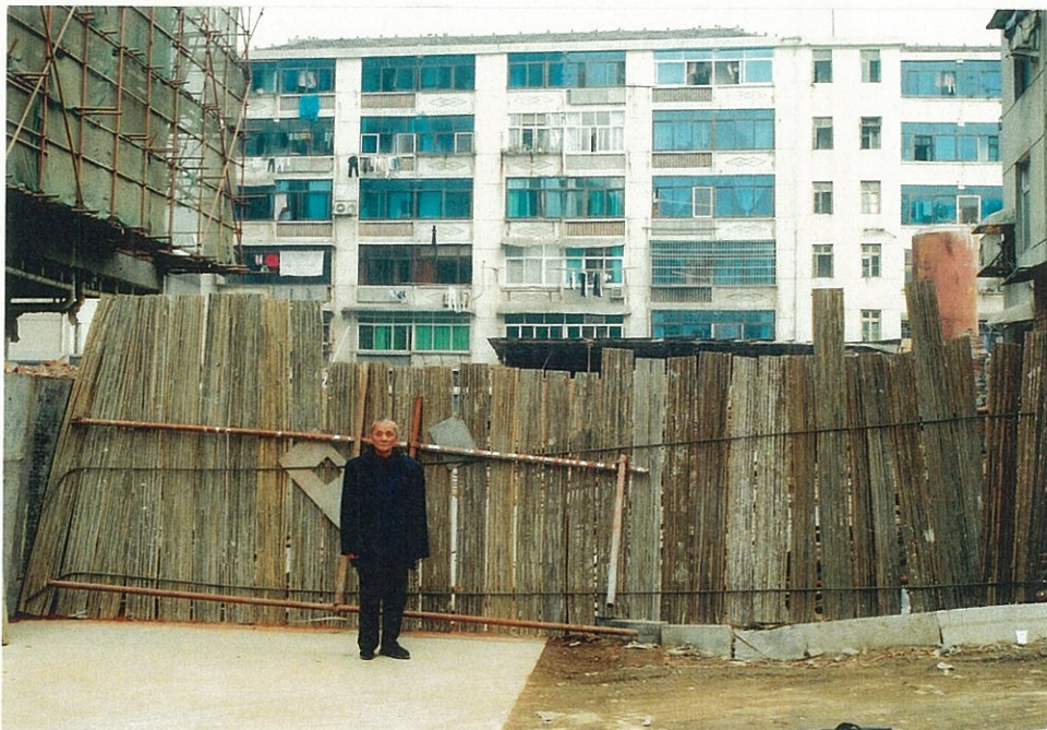
写真の手前方向が、新しい商店街と整備中の地域。写真の左側には大きなビルを建設中。常德市内で最も開発の進んでいる地域。